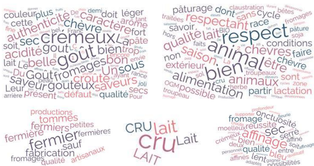
Figure 3. Nuages de mots obtenus à partir des réponses de crémiers-fromagers sur le thème de la caractérisation des fromages de chèvre « bons et bien faits ».

critères de qualité des fromages, nous avons créé des nuages de mots, qui sont des représentations visuelles des termes les plus fréquemment utilisés dans les réponses ouvertes et rendent donc compte du poids relatif du vocabulaire emprunté (Figure 3). Remarquons que le vocabulaire pour parler du goût ou des conditions d'élevage est beaucoup plus diversifié que pour évoquer le lait cru ou la production fermière et artisanale ou encore l'affinage. Dans la famille du goût, nous retrouvons les mots « crémeux, bon, saveur, pas de défaut, caractère, authentique, etc. ».