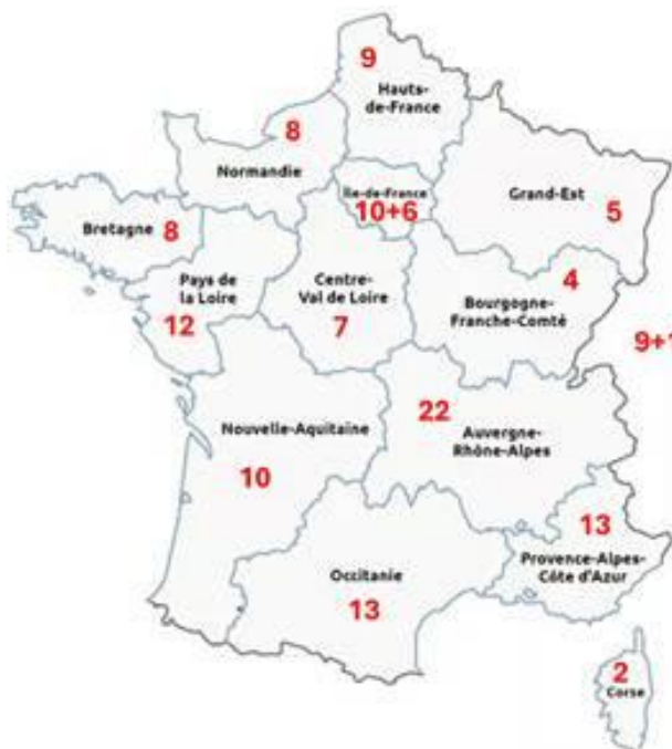
Figure 1. Origine géographique des 139 crémiers-fromagers ayant répondu à l'enquête. Pour l'Ile-de-France, 6 à Paris et 10 hors de Paris. Hors carte : 9 origines inconnues et 1 à Munich.

Au total, 139 fromagers originaires de toutes les régions françaises (Figure 1) ont répondu à cette enquête. Parmi eux, 94 (73 %) ont une boutique, 20 (16 %) sont sur les marchés et 14 (11 %) sont présents dans les deux lieux.